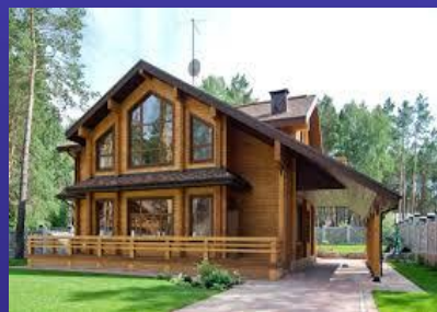
Строительство по проекту или покупка у аккредитованного застройщика нового дома