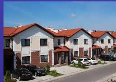
Покупка у аккредитованного застройщика таунхауса