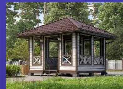
Малые архитектурные формы (бани, беседки, гаражи, террасы, веранды, бытовки)